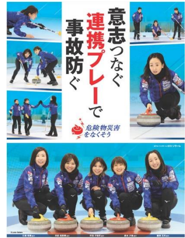
危険物安全週間推進ポスター