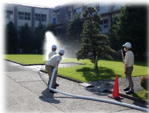
自衛消防隊 消火訓練