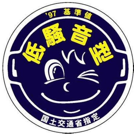
様式第4号（第十条関係）