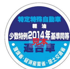
オフロード法 2014年基準適合表示（ラベル）、少数特例表示（ラベル）