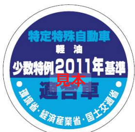
オフロード法 2011年基準適合表示（ラベル）、少数特例表示（ラベル）