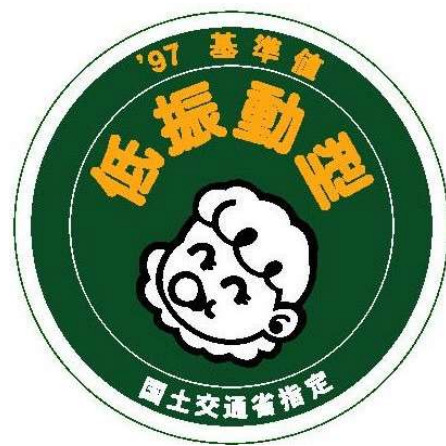
様式第6号（第十条関係）