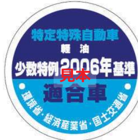
オフロード法 2006年基準適合表示（ラベル）、少数特例表示（ラベル）