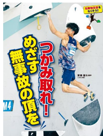
危険物安全週間推進ポスター