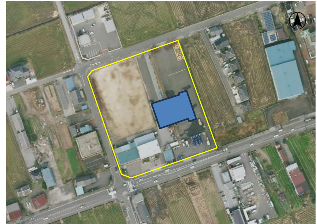
(庁舎配置イメージ)